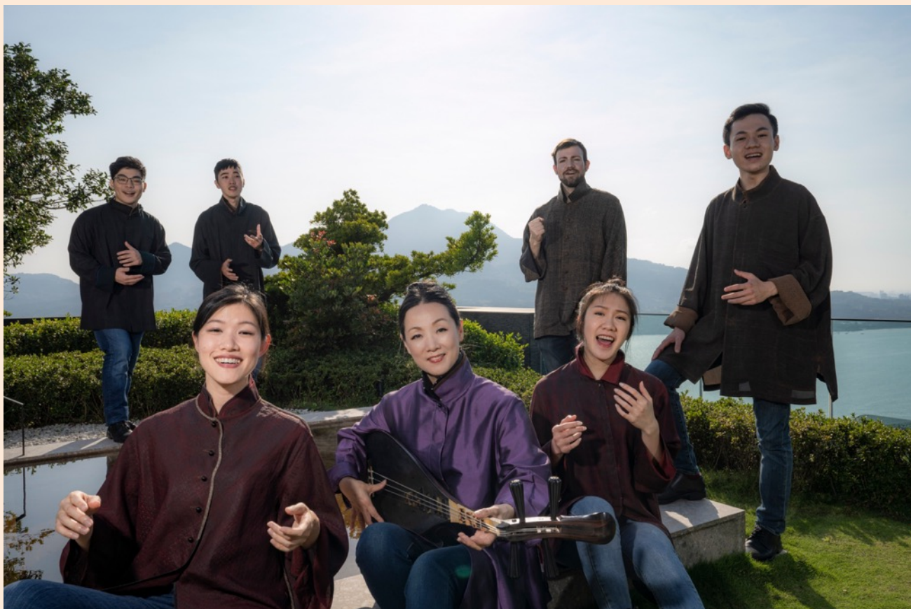
2021年《人聲很南管》宣傳照（宣傳照服裝設計 / 洪麗芬）

心心南管樂坊與 Voco Novo 爵諾歌手，跨越時間的河流，共同詮釋唐詩宋詞。南管搭配人聲編制，用河洛話呈現詩詞；人聲音樂利用南管譜曲改編曲韻，彼此既有獨立呈現片段，又有合作片段，豐富多元。